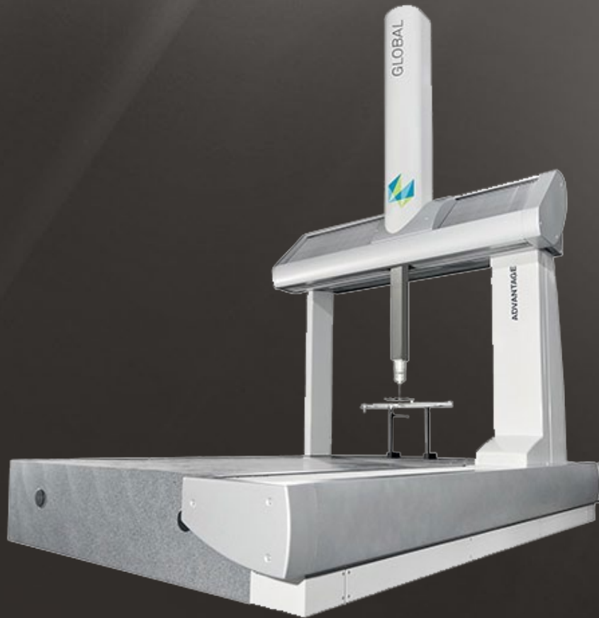
Hexagon Global Advantage KMG 900x1500mm