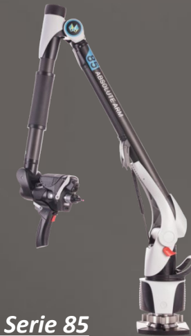
Hexagon Serie 85 3D Laser Scan Arm 2,2m Reichweite Scannen, Digitalisieren und Tasten