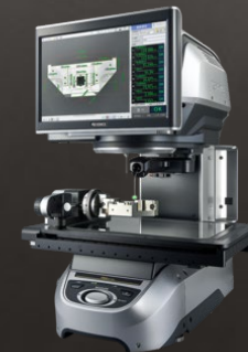
Keyence IM-8000 Vollautomatischer Messprojektor mit Tastsensor, 4.Achse und optischer Messkugel